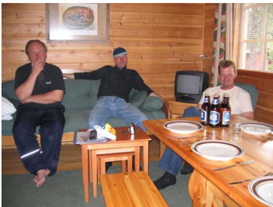
SAAKO TÄÄLLÄ EDES RUOKAA?