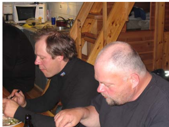
KOHTI HERKISTYNYTTÄ TILAA...